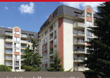
La résidence de Maurepas aujourd'hui

IRP poursuit sa campagne de réhabilitation pour améliorer l'isolation thermique et la qualité de vie de ses résidences. Cet automne ce sont les résidences de Maurepas et Versailles Célestins qui bénéficient de mises en chantier. Selon les sites : ravalement, création d'une isolation par l'extérieur, remplacement des menuiseries extérieures, remplacement des radiateurs, mise en sécurité électrique, amélioration de la VMC, création d'abris containers extérieurs, mise en place d'un contrôle d'accès... sont au programme de ces travaux qui dureront entre 8 et 12 mois.