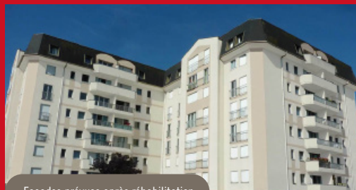
Façades prévues après réhabilitation